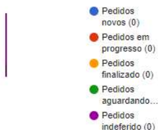
Atividade da Ouvidoria Pública - ESTATÍSTICAS GERAIS